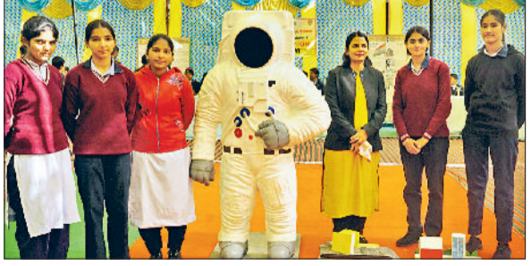
फतेहाबाद। जिला स्तरीय विज्ञान प्रदर्शनी में भाग लेते विद्यार्थी।