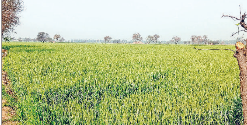
फतेहाबाद। तेज धूप में खड़ी गेहूं की फसल।

सर्दी के बाद बसंत ऋतु शुरू होती थी तो ठंडी हवाओं का दौर चलता था। अब इसके विपरीत सर्दी के बाद सीधा गर्मी-का सा अहसास हो रहा है। बीते 16 वर्षों में पहली बार है कि फरवरी के दूसरे सप्ताह में ही तापमान 26 डिग्री को पार कर गया जबकि रात का तापमान 12 डिग्री के आसपास चल रहा है। इस तरह दिन और रात के तापमान में 14 डिग्री का अंतर आ गया है, जो गेहूं और अन्य फसलों के साथ-साथ मनुष्यों के लिए भी कर्ताई ही अनुकूल नहीं कहा जा सकता। यही वजह है कि नागरिक अस्पताल में वायरल बुखार व खांसी-जुकाम के मरीजों की तादाद में काफी वृद्धि हुई है। दरअसल मौसम विभाग ने 6 व 9 फरवरी को दो पश्चिमी विक्षोभ के एक्टिव होने से बूदाबांदी व बदल जाने की भविष्यवाणी की थी लेकिन दोनों डबल्यूडी निष्क्रिय रहने से तापमान कम होने की बजाय बढ़ने लगा है। अब उत्तर पश्चिमी हवाएं चलने से यह फसलों के साथ-साथ मानव शरीर के लिए भी नुकसानदेय हो