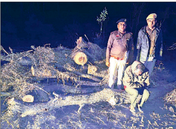
सिरसा। चोरीशुदा काटे गए पेड़ के साथ पकड़ा गया आरोपी।