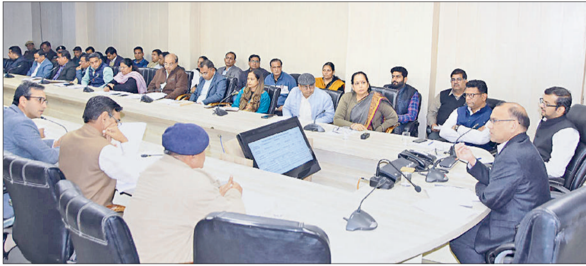
फतेहाबाद। अधिकारियों की बैठक को संबोधित करते डीसी।