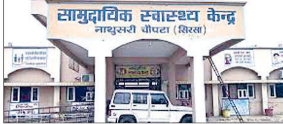
सिरसा। चोपटा के सामुदायिक स्वास्थ्य केंद्र का दृश्य।