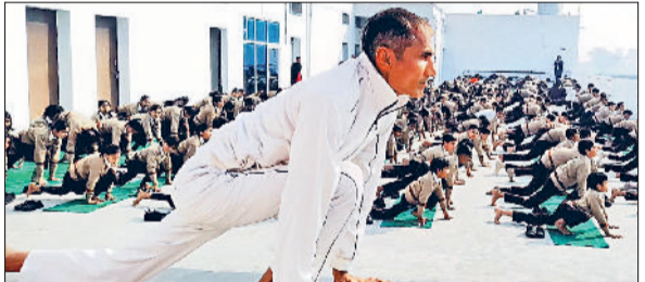
भट्टूकला। विद्यार्थियों को सूर्य नमस्कार करवाते योग शिक्षक।

बहाल करने, 60 वर्ष की आयु उपरांत पेंशनर्ज के लिए रेल में रियायती दर पर मुफ्त यात्रा सुविधा पुनः लागू करने की मांग की है।